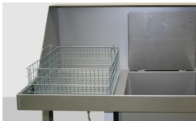
Reinigungskorb in Abtropfposition