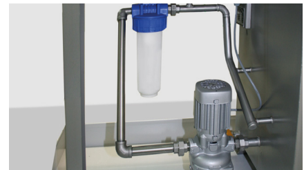
Pumpe und Filter