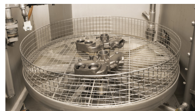
Dreh-Waschkorb mit Spritz- und Abblas-Düsen